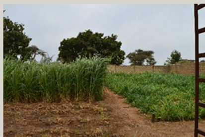
Agua del pozo y riego de los cultivos