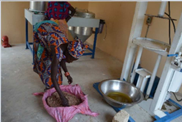
Taller de costura