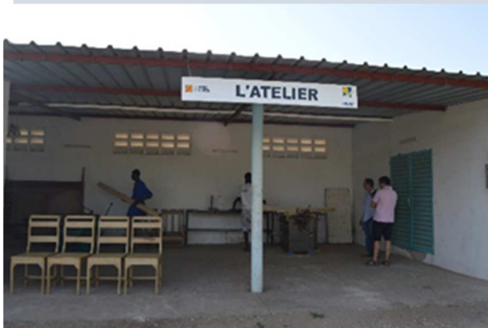
Taller de carpintería y práctica de los alumnos